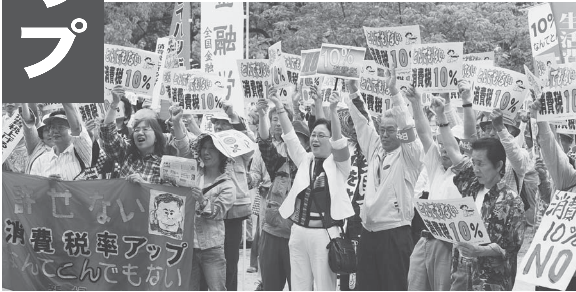
全国全道で反対の大きな声があがっています。