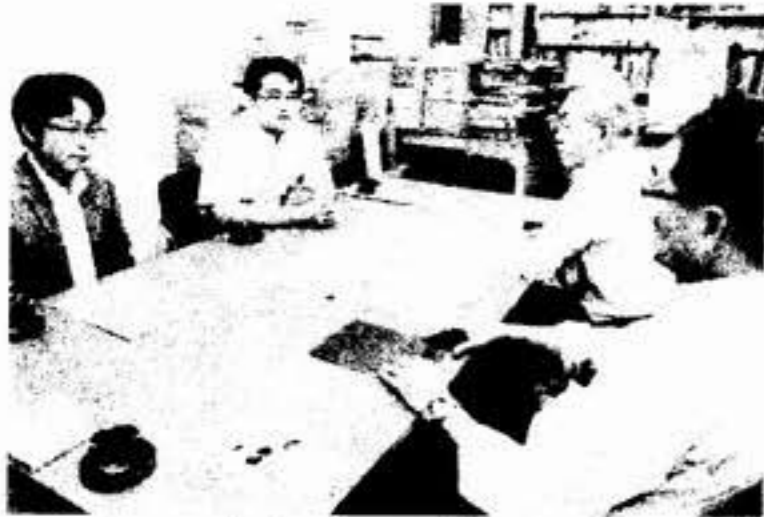
アピールの内容を伝えて共同をよびかける (左から) 森国政相談室長、島山政策委員長 の両氏 = 6日、札幌市の北海道商店街振興 組合連合会