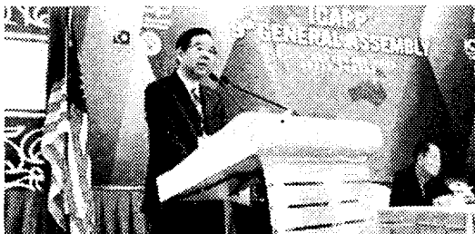
アジア政党国際会議で発言する日本共産党・志位和夫委員長（マレーシア・クアラルンプール）