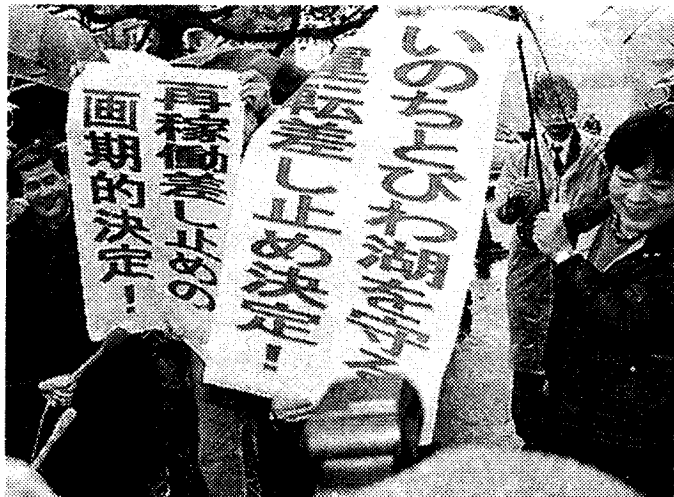
関電高浜原発の運転差し止めの大津決定を喜ぶ人たち(11月3日、大津市)