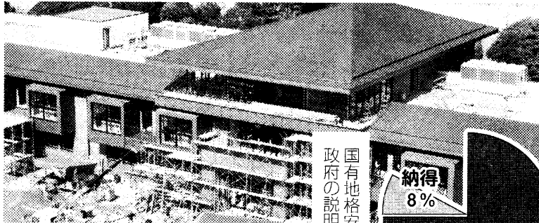
申請が取り下げられた「森友」小学校