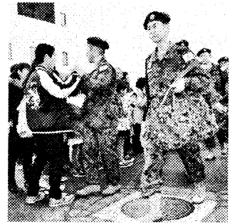
南スーダン出発前に家族と握手を交わす隊員(2016年11月20日、青森空港)

政府は南スーダンPKO(国連平和維持活動)に派兵している陸上自衛隊を5月末に撤退させることを決めました。「海外で戦争する国」づくりの第一歩にする狙いでしたが、大破たんに追い込まれました。