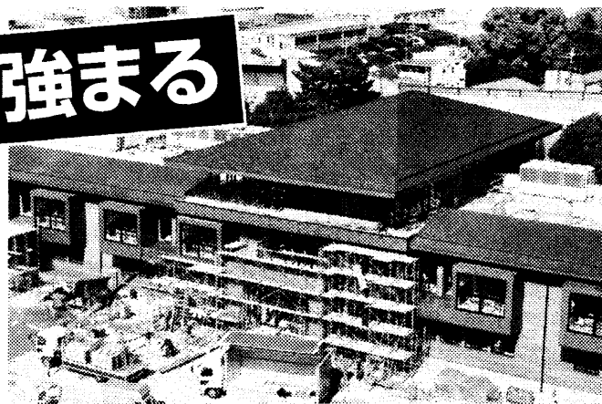
▲申請が取り下げられた「森友」小学校