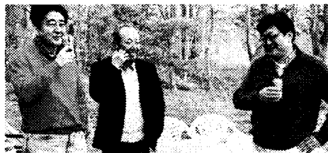
安倍首相(左)、加計理事長(中)、萩生田光官房副長官(右) 13年5月、安倍氏の別荘で

「速やかに九条二項を削除するか、あるいは自衛隊を明記した第三項を加えて二項を空文化させるべき」 (小坂実・日本政策研究センター研究部長・明日への選択 昨年11月号) *日本政策研究センター代表は日本会議の政策委員。