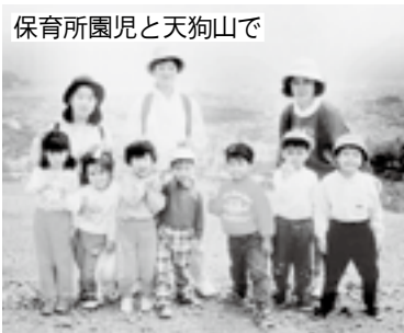
保育所園児と天狗山で

道議会での日本共産党の議席は106のうち2議席です。しかしこの2議席が議会の発言回数で1位と2位を占め、大規模林道を中止させ、小樽市の財政規模に匹敵する600億円の税金のムダ使いをやめさせました。スゴイことです。