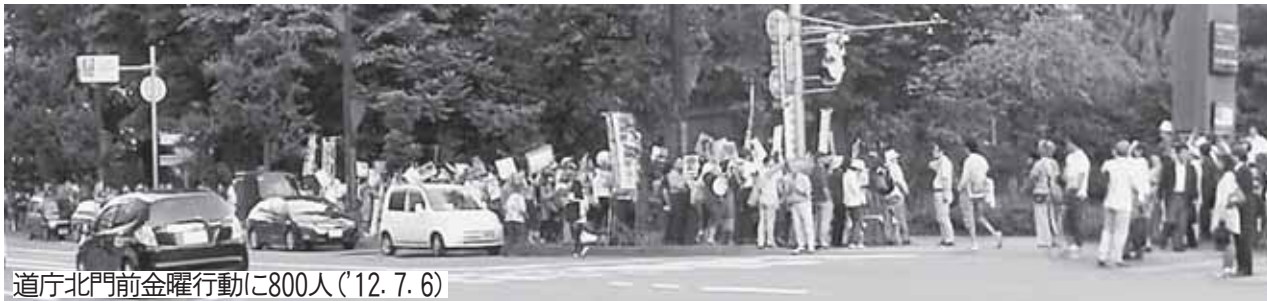
道庁北門前金曜行動に800人(12.7.6)

2012年度第2回定例道議会が6日閉会しました。3週間の会期中に、野田首相のゴーサインで福井・大飯原発3号機が再稼働しました。全国で原発再稼働反対の運動が広がるなか、日本共産党の真下道議は、泊原発をめぐり問題に鋭く切り込み、道政を大きく動かしました。